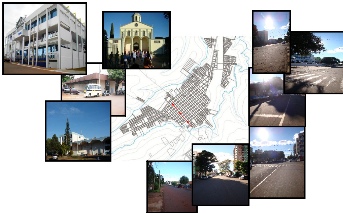
Figura 3 – Mapa da cidade com destaque para a Rua São Josafat e seus elementos

Na Figura 3, podem-se observar setas em tom vermelho, que demarcam a Rua São Josafat, a qual foi analisada neste estudo. As imagens localizadas à esquerda da Figura 3 mostram algumas edificações localizadas na via, as quais são pontos de referência do ambiente, e as imagens à direita da Figura 3, representam uma sequência fotográfica da via, no sentido Sudeste/Noroeste, mostrando a paisagem que o transeunte encontra em seu caminhar.